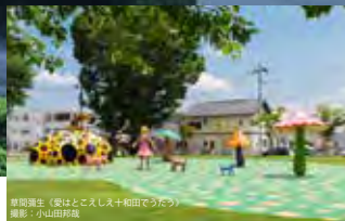
常陸選手（愛はとこえし十和田でうたつ）

「日本の道100選」にも選ばれ、1.1kmにわたる桜並木に156本の桜が咲き誇ります。夜はライトアップされた夜桜を楽しめ、市役所の展望ロビーからは、駒街道一面に咲く桜を堪能できます。