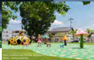
Yayoi Kusama Love Forever, Singing in Towada.

During this time, Towada City provides custom illumination, letting people enjoy the flowers in to the evening as well. The observation room, on the top of city hall, is open to the public and boasts a birds-eye view of blossoms that turn the entire road pink.