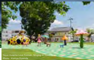
Yayoi Kusama Love Forever, Singing in Town

駒街道以貫通1.1km綻放在道旁，數量達156株的櫻樹而聞名，在“日本道路百選”中也有入選。在這裏夜間可以欣賞到燈光下的夜櫻。而從市政廳的展望大廳，則可以飽覽開遍整條駒街道的櫻花。